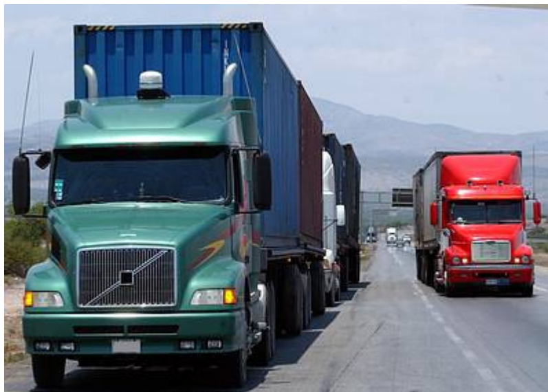
Camioneros: ¡ Los amigos en la carretera !

Es su manera de expresar su alegría por el feliz regreso y transmitir, al mismo tiempo, tranquilidad a su familia que siempre está en situación de espera y de alerta permanente.