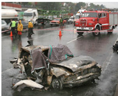
Hagamos un llamamiento a la prudencia.

A los padres y madres conductores hay que hacer un llamamiento a la responsabilidad cuando llevan a sus hijos en el vehículo que conducen. El automóvil también es un lugar adecuado para seguir educando a nuestros hijos. Hemos de mostrarles que, en la utilización de ese medio de transporte, hay que usar valores tan importantes como la PRUDENCIA, la SERENIDAD, la SOLIDARIDAD y debemos ser ejemplo para ellos de una conducción consciente y responsable.