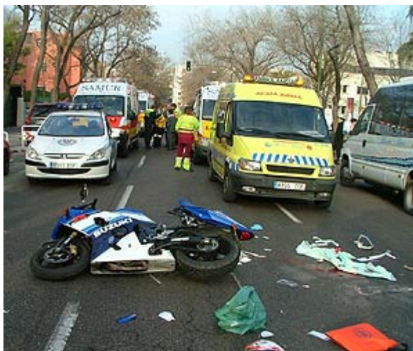
Demasiados jóvenes fallecen en accidentes con motocicletas.

Los accidentes de tráfico constituyen la causa principal de las discapacidades y minusvalías físicas. Causan entre el 60 y el 80% de personas parapléjicas y tetrapléjicas.