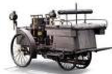
Primer automóvil a vapor

Sin embargo su definición como " seguridad y comodidad de los caminos y tránsitos para la fácil comunicación " se lo debemos a un Real Decreto de 1778 , que ciertamente sigue inspirando al Organismo Autónomo Jefatura Central de Tráfico, conocido por todos, como Dirección General de Tráfico.