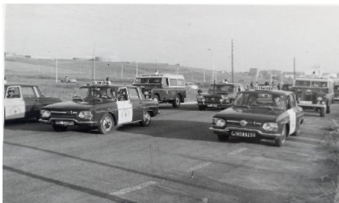
Guardia Civil de Tráfico en los antiguos R-10.

Por ello, desde 1959 hasta hoy, la Guardia Civil desempeña la vigilancia del tráfico. De hecho, y una vez publicada la Constitución de 1978, la Ley Orgánica de 13 de marzo, de Fuerzas y Cuerpos de Seguridad del Estado, dispone en su artículo 12 que serán ejercidas por la Guardia Civil: "la vigilancia del tráfico, tránsito y transporte en las vías públicas interurbanas".