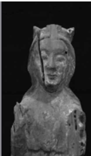
Foto 3. Santa Lucía

- Grietas y fendas producidas por los cambios de humedad y temperatura a los que ha estado sometida durante casi 800 años.