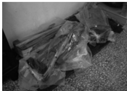
Foto 5. Varias tallas en desinsección.

Tratamientos curativos y preventivos. Sometidos durante 10 días a una atmósfera tratada y hermética.