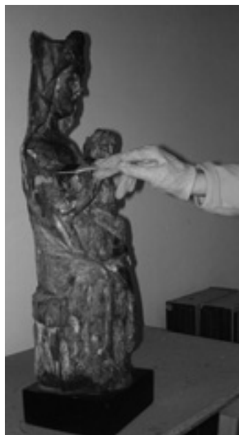
La Virgen de Guía.

5º.- Reintegración cromática: es la restitución de la capa de color en las zonas donde se ha perdido, que aún conserva su estucado o enyesado en buen estado. Para diferenciar este proceso reconstitutivo de los restos conservados de policromía original, se