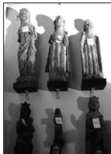
Foto 2. Almacén Museo Diocesano