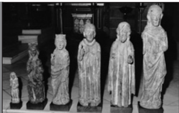
Foto1. Tallas en una de las exposiciones realizadas con anterioridad.

En primer lugar se visitan las Tallas en las dependencias del Museo Diocesano de Córdoba donde se encontraban depositadas, y se realiza una primera evaluación de su estado real de conservación y de las necesidades para su reparación o subsanación. Esto supone la elaboración y redacción de un Proyecto de Conservación y Restauración donde se recogen documental y fotográficamente todas las observaciones,