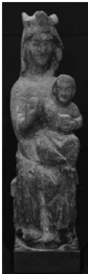
Foto 4. Virgen de Guía.

Conseguido el presupuesto económico para