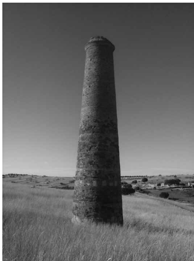
Chimenea de Araceli en 2017