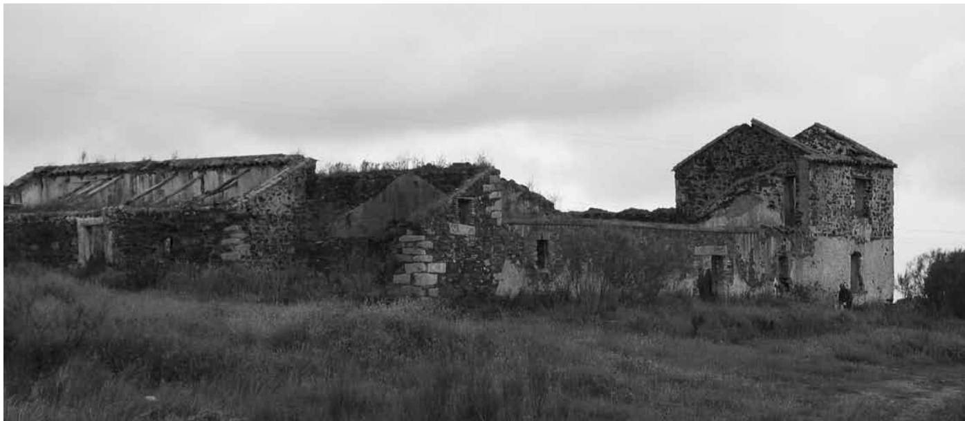
Instalaciones de mina Araceli: talleres, almacén y patio de minerales, maderas y carbones.