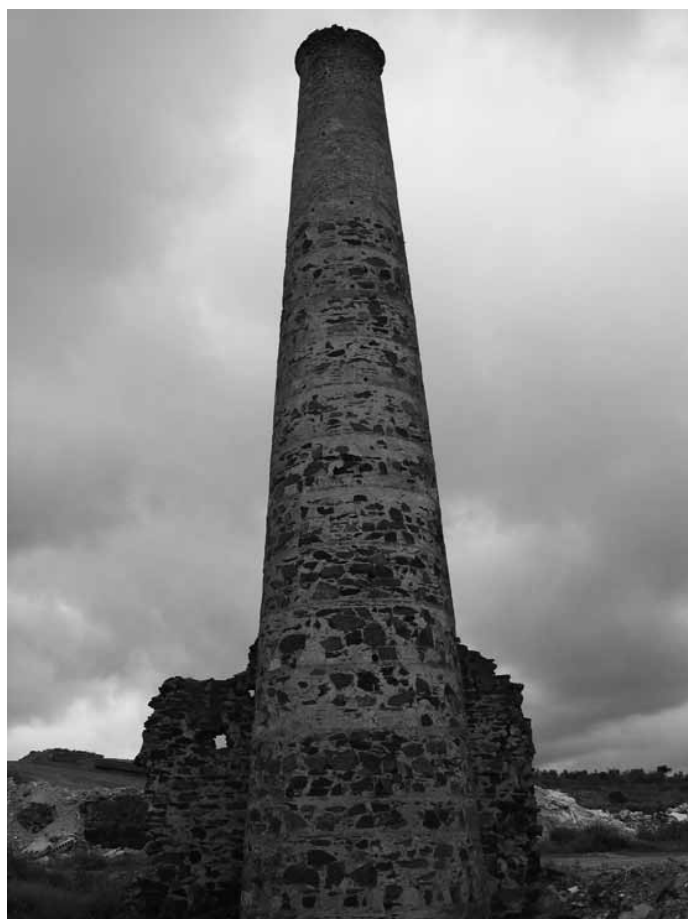
Chimenea de Araceli, antes del centro de almacenamiento

Gracias a las actas conservadas de las visitas a Araceli por parte de la jefatura de minas de