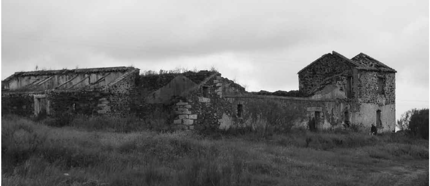
Instalaciones de mina Araceli: talleres, almacén y patio de minerales, maderas y carbones.