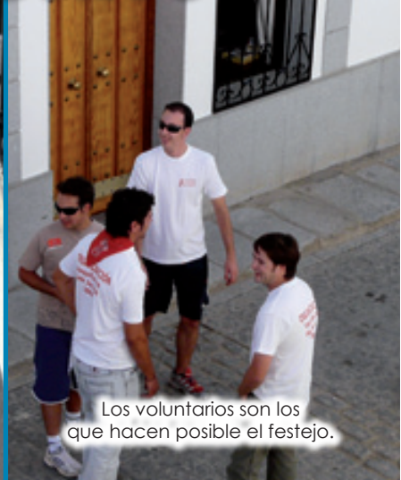
Los voluntarios son los que hacen posible el festejo.