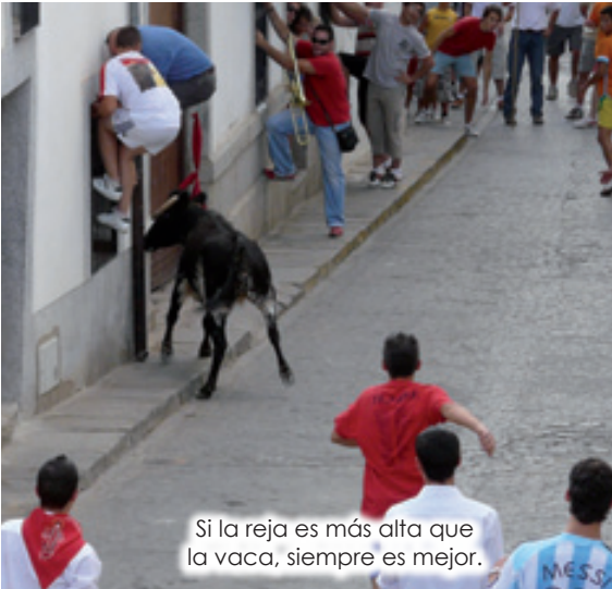
Si la reja es más alta que la vaca, siempre es mejor.