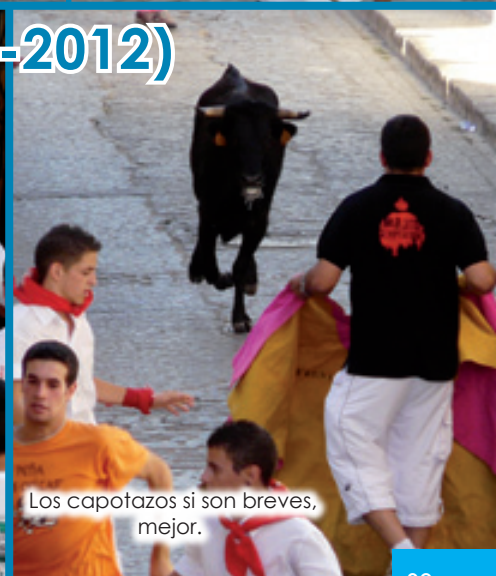
Los capotazos si son breves, mejor.