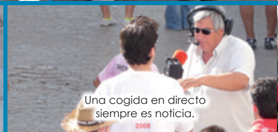
Una cogida en directo siempre es noticia.