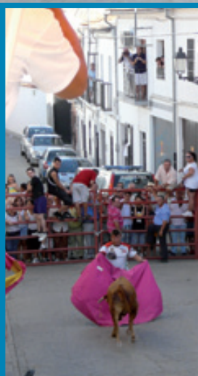
"O te compro un cortijo, o te visto de luto"