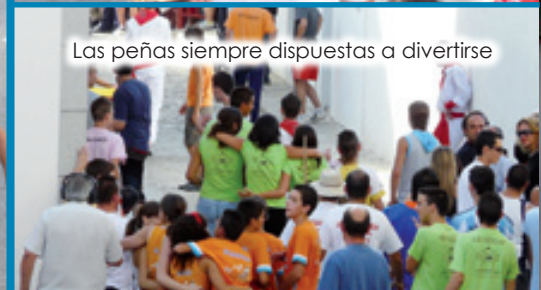
Las peñas siempre dispuestas a divertirse