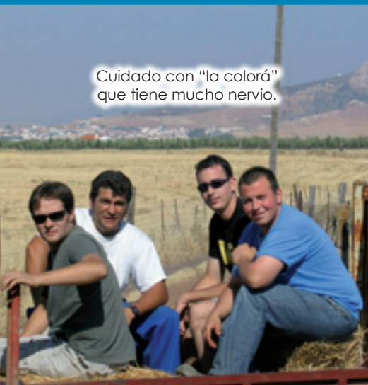
Cuidado con "la colorá" que tiene mucho nervio.