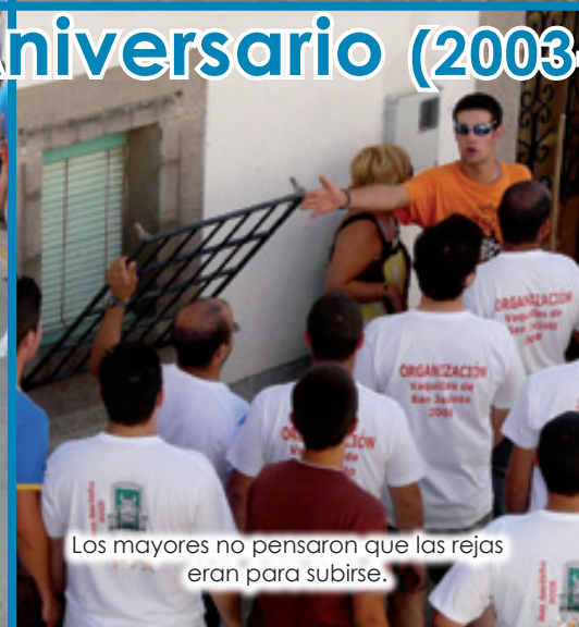
Los mayores no pensaron que las rejas eran para subirse.