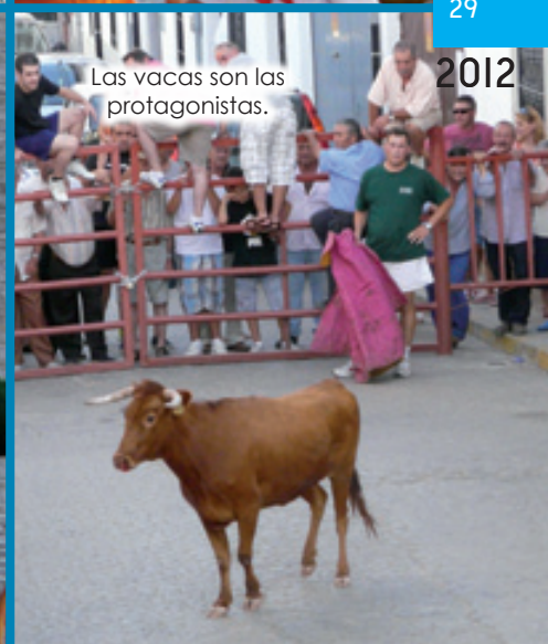
Las vacas son las protagonistas.