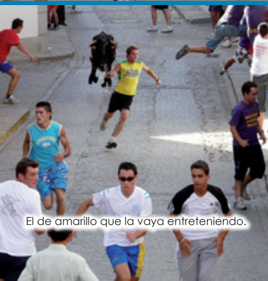
El de amarillo que la vaya entreteniendo.