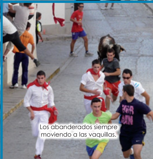
Los abanderados siempre moviendo a las vaquillas.