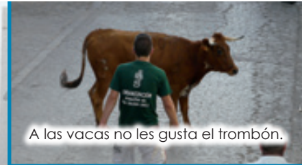
A las vacas no les gusta el trombón.