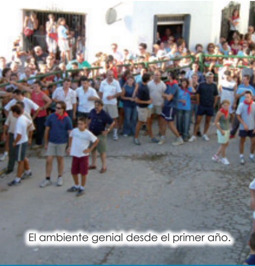
El ambiente genial desde el primer año.