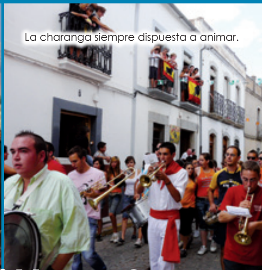
La charanga siempre dispuesta a animar.