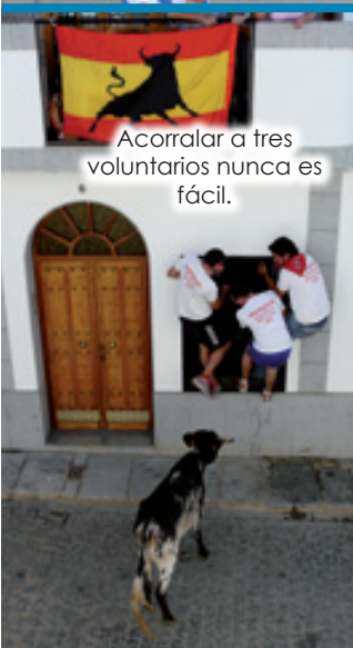
Acorralar a tres voluntarios nunca es fácil.