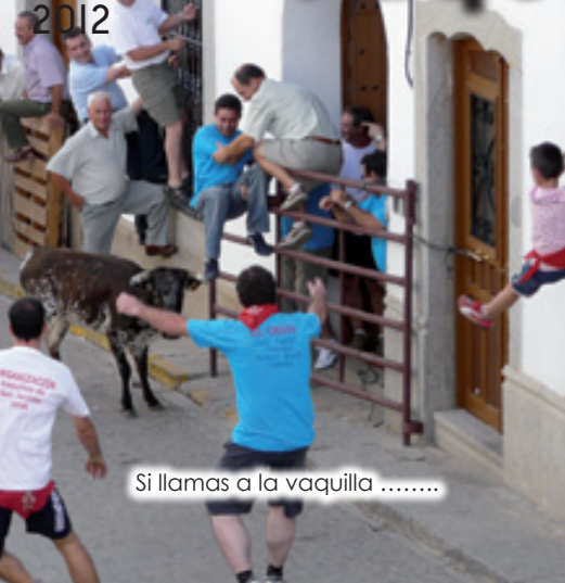
Si llamas a la vaquilla .....