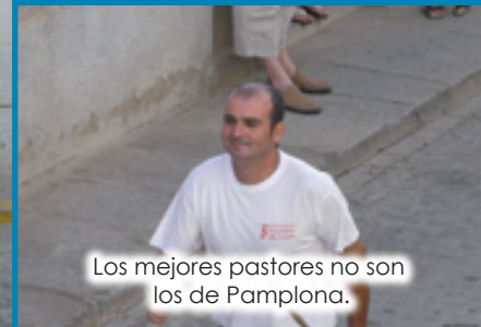
Los mejores pastores no son los de Pamplona.