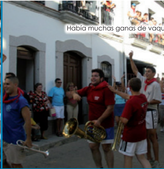
Había muchas ganas de vaquilla, demasiados años sin ellas.