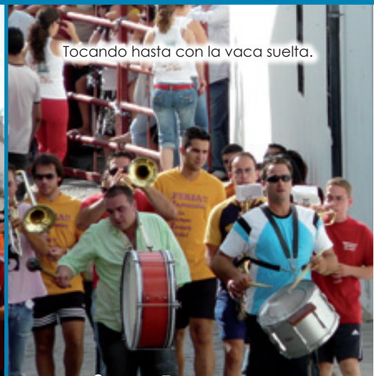
Tocando hasta con la vaca suelta.