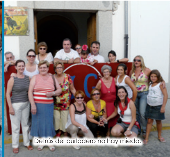
Detrás del burladero no hay miedo.