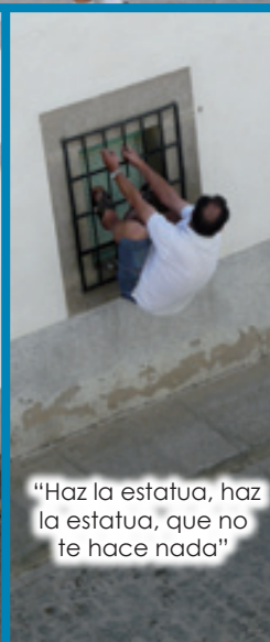
"Haz la estatua, haz la estatua, que no te hace nada"