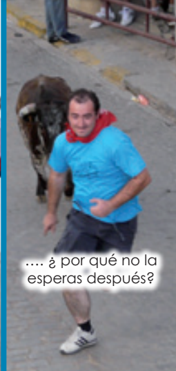
.... ¿ por qué no la esperas después?