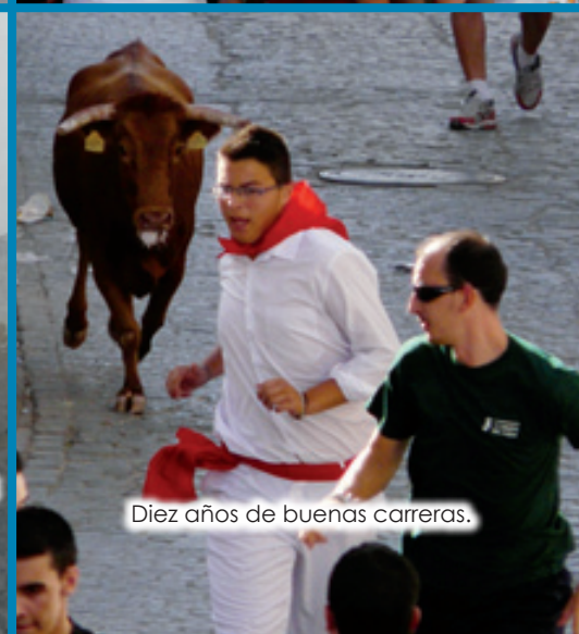
Diez años de buenas carreras.