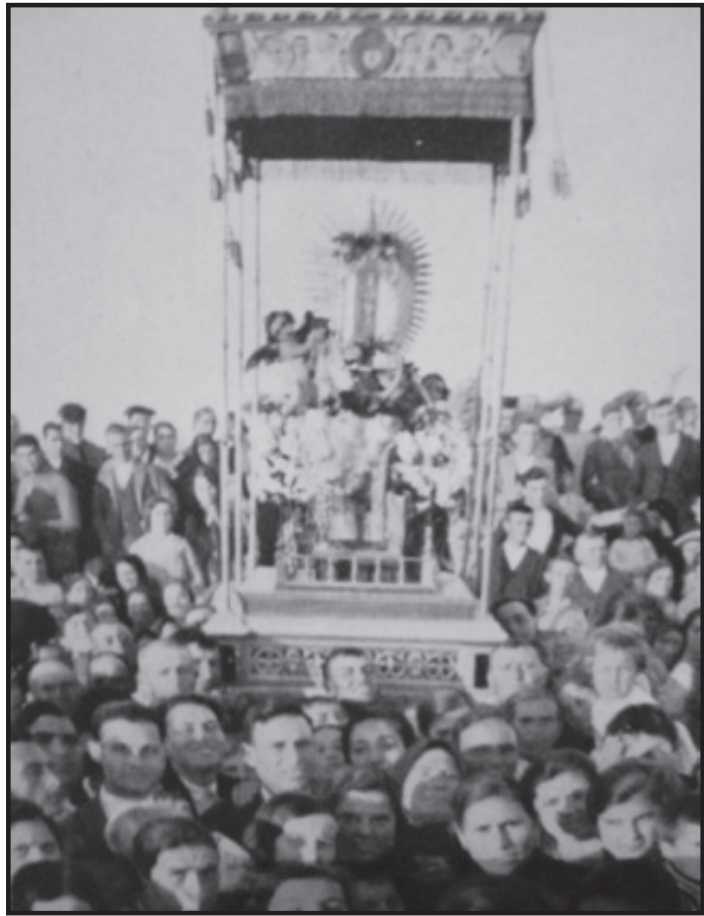
Hinojosa del Duque. 2 de mayo de 1932

Así pues, nos podemos imaginar el clima de tensión y de rivalidad que debía reinar entre Villanueva e Hinojosa y que desembocó en la Concordia de 1654. Como dato curioso y de capital importancia hay que destacar el hecho de que en la Concordia se deje claro que ni Villanueva ni Hinojosa tenían que solicitar licencia a otro pueblo para retirar la bendita imagen en las fechas que les correspondían. Más abajo se dejará claro que Alcaracejos y Torremilano (Dos Torres) sí que debían pedir licencia a ambos pueblos cuando fueran a trasladar la imagen. Teniendo en cuenta que el término que correspondía por aquel entonces a Villanueva no sobrepasaba los 500 pies desde las últimas casas de la localidad y que la Ermita de Ntra. Sra. de Guía no entraba por tanto dentro de ese término, la situación en la que queda nuestro pueblo dentro de la Concordia de 1654 es de cierto privilegio puesto que goza de las mismas prerrogativas y derechos de Hinojosa del Duque que era entonces a quien correspondía el término sobre el que estaba construida la Ermita y que tenía la jurisdicción sobre la misma.