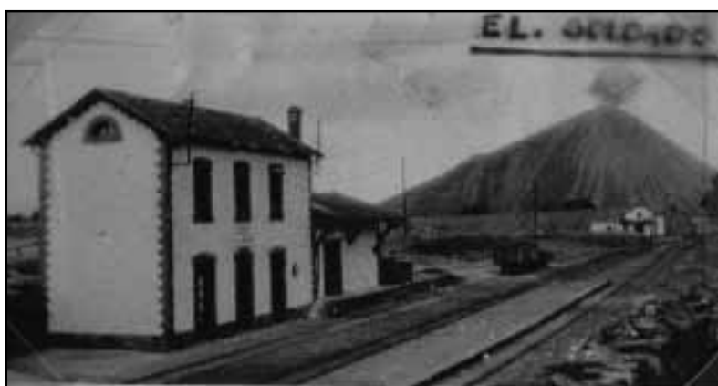
Estación El Soldado (vista del lado de Alcaracejos). Al fondo la caseta de 1º obrero, el “Terry” y vías dirección a Peñas Blancas-Cámaras Altas-Belmez y Peñarroya-Pueblonuevo (Foto: Ángel Perry Muñoz, jefe de estación de la línea).

El primer día de siglo XX, la SMMP adquirió las hulleras de Belmez de los ferrocarriles Andaluces y se comprometió a ser la suministradora de sus locomotoras. Como poco después incorporó a sus haberes a la Minera Antracita, asegurándose fuertes reservas energéticas, buscó dirigir sus trenes al encuentro del plomo localizado al este